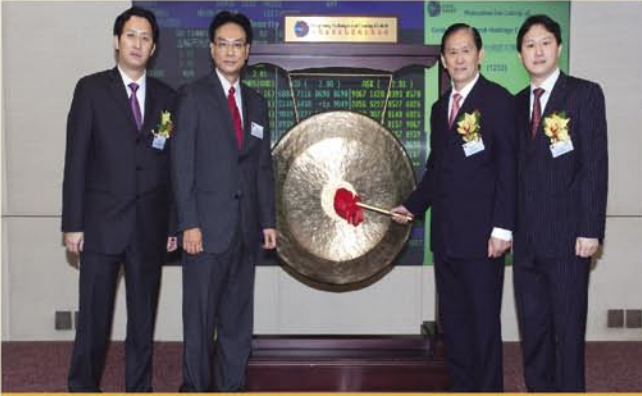
成功上市 前程似錦