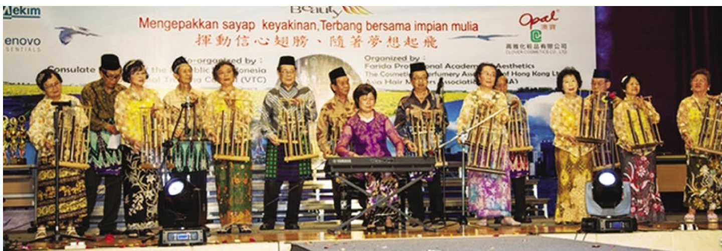
60年屆的 angklung 隊伍